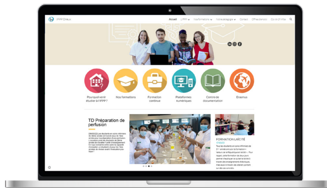
IFPP de Dreux www.ifs-i-dreux.fr